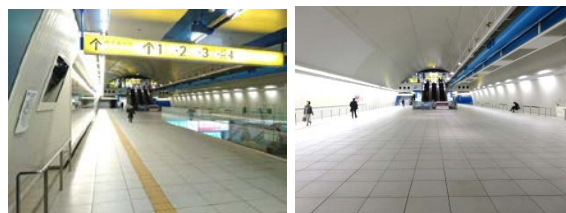
②みなとみらい駅 みらいチューブ (屋内)