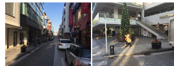
⑥元町ショッピングストリート (屋外)