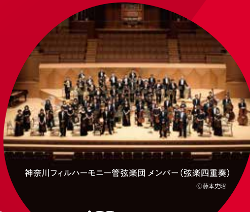
神奈川フィルハーモニー管弦楽団メンバー(弦楽四重奏)